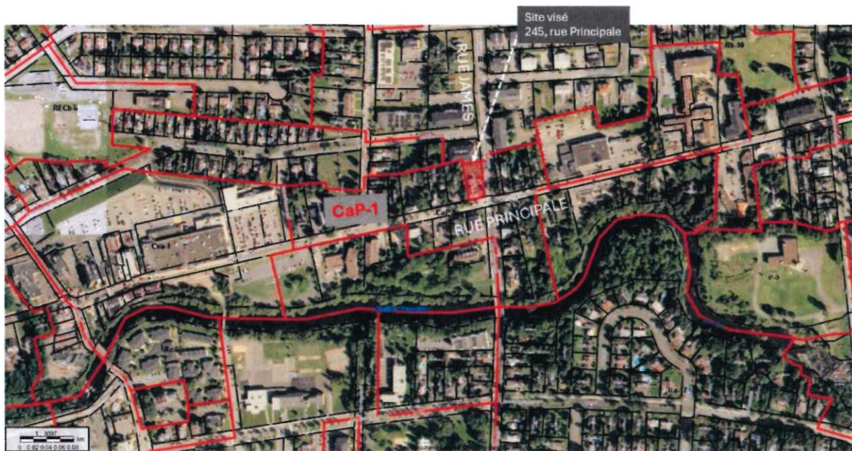
(Secteur du 245 rue Principale)

Ce projet de résolution contient des dispositions susceptibles d'approbation référendaire.