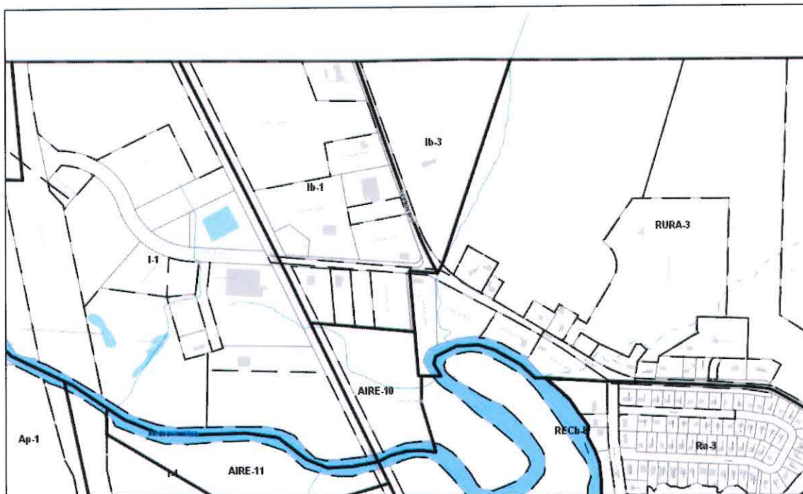
Secteur de la zone Ib-1 – chemin Brosseau

Le secteur concerné, par les dispositions 2), 3), 4) et 5) ci-haut, ainsi que la disposition 6) ci-haut, sont identifiés ci-dessous :