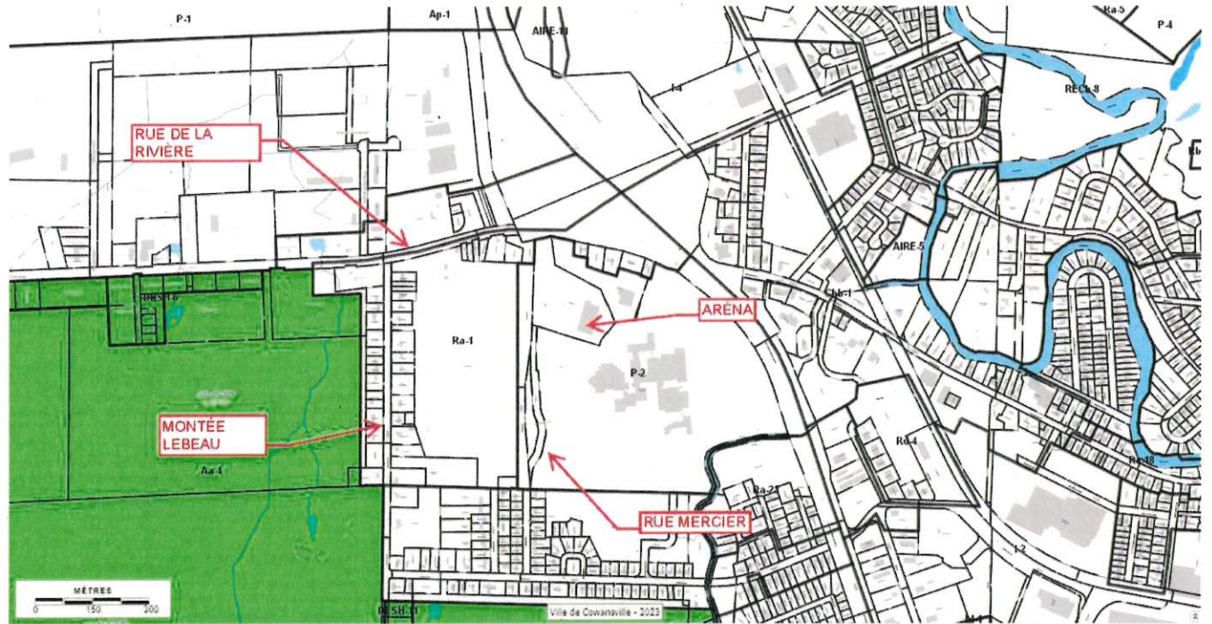
(Secteur de l'école secondaire Massey-Vanier, l'aréna et le centre aquatique)

La zone concernée, par les dispositions de l'article 2.) ci-haut, est constituée des zones P-2, Ra-1 et des zones contiguës Cg-1, I-4, Cbb-1, Cgl-2, Ra-23, Ra-2 et Aa-1 qui sont illustrées au croquis suivant :