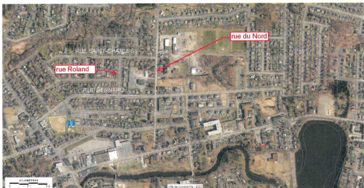
(Secteur des rues Bernard, Rolland, Saint-Charles et du Nord)

Le secteur concerné, par les dispositions résumées ci-haut, concernant le présent projet de règlement, est situé dans le secteur des rues Bernard, Saint-Charles, Roland et du Nord, est identifié ci-dessous :