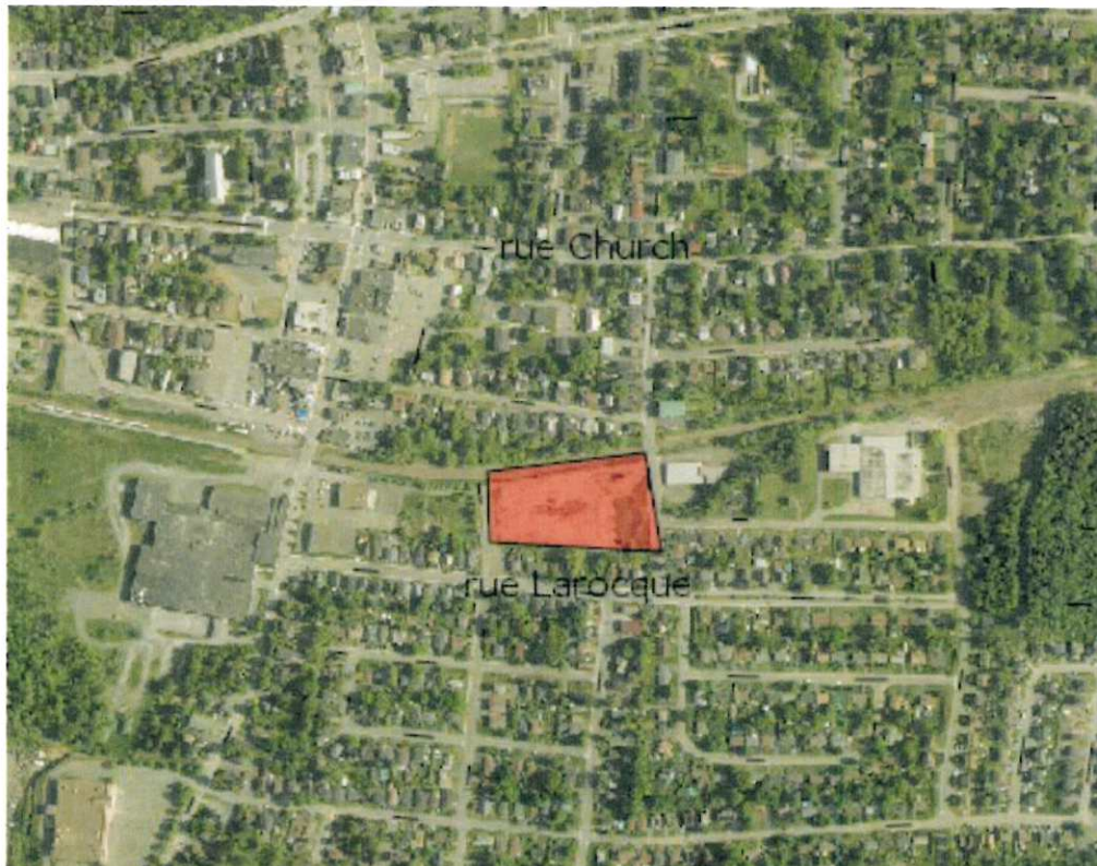
(Secteur des rues d'Oxford, Barker, Larocque et de la voie ferrée.)

Le secteur visé par le présent projet de règlement, situé dans le secteur des rues Barker, d'Oxford, Larocque et de la voie ferrée, est identifié ci-dessous :