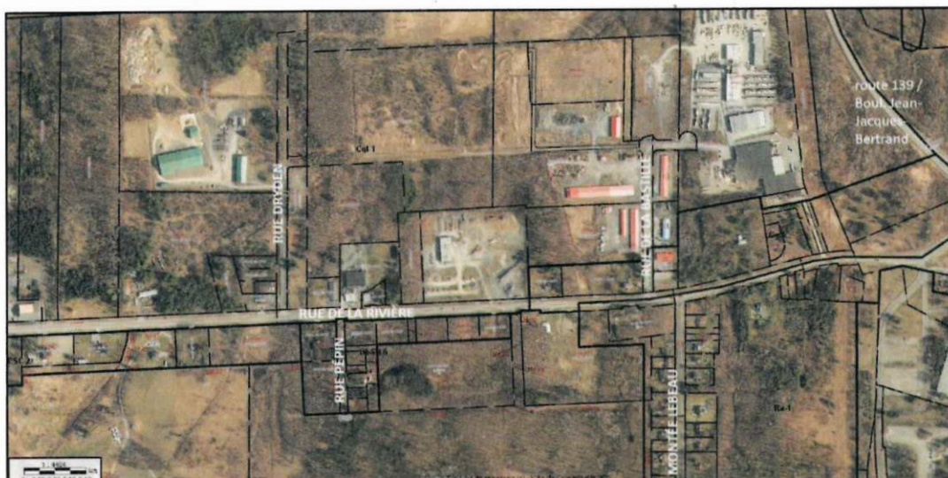
(Secteur du 520 rue de la Rivière)

Que la zone concernée par les dispositions de l'article est constituée de la zone Cgl-1 et des zones contiguës P-1, Ap-1, I-4, Cg-1, Aa-4, DESH-6, DESC-2, DESH-5 et Aa-2 qui sont illustrées au croquis suivant :