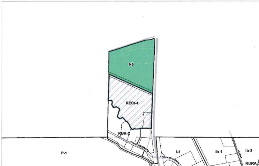
(Secteur rue Maple-Dale et chemin Brosseau)

La zone concernée, par la disposition 2) ci-haut, est constituée de la zone I-5 et de la zone contiguë REct-1 qui sont illustrées au croquis suivant :